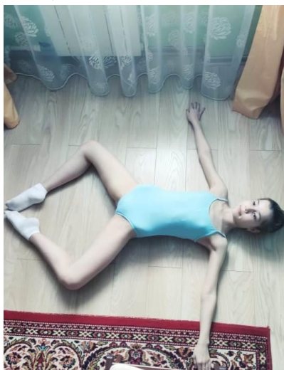
Лягушка: лёжа на спине.